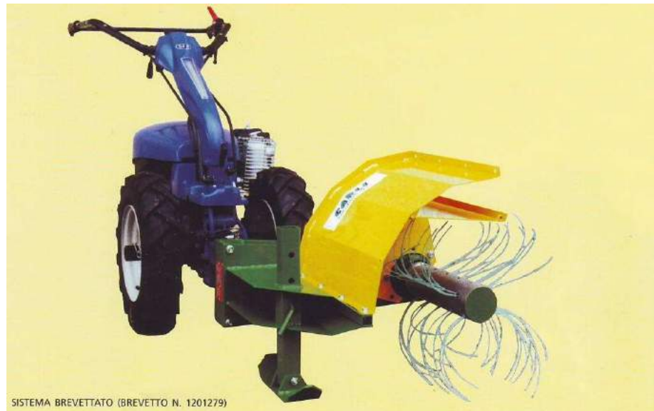
SISTEMA BREVETTATO (BREVETTO N. 1201279)